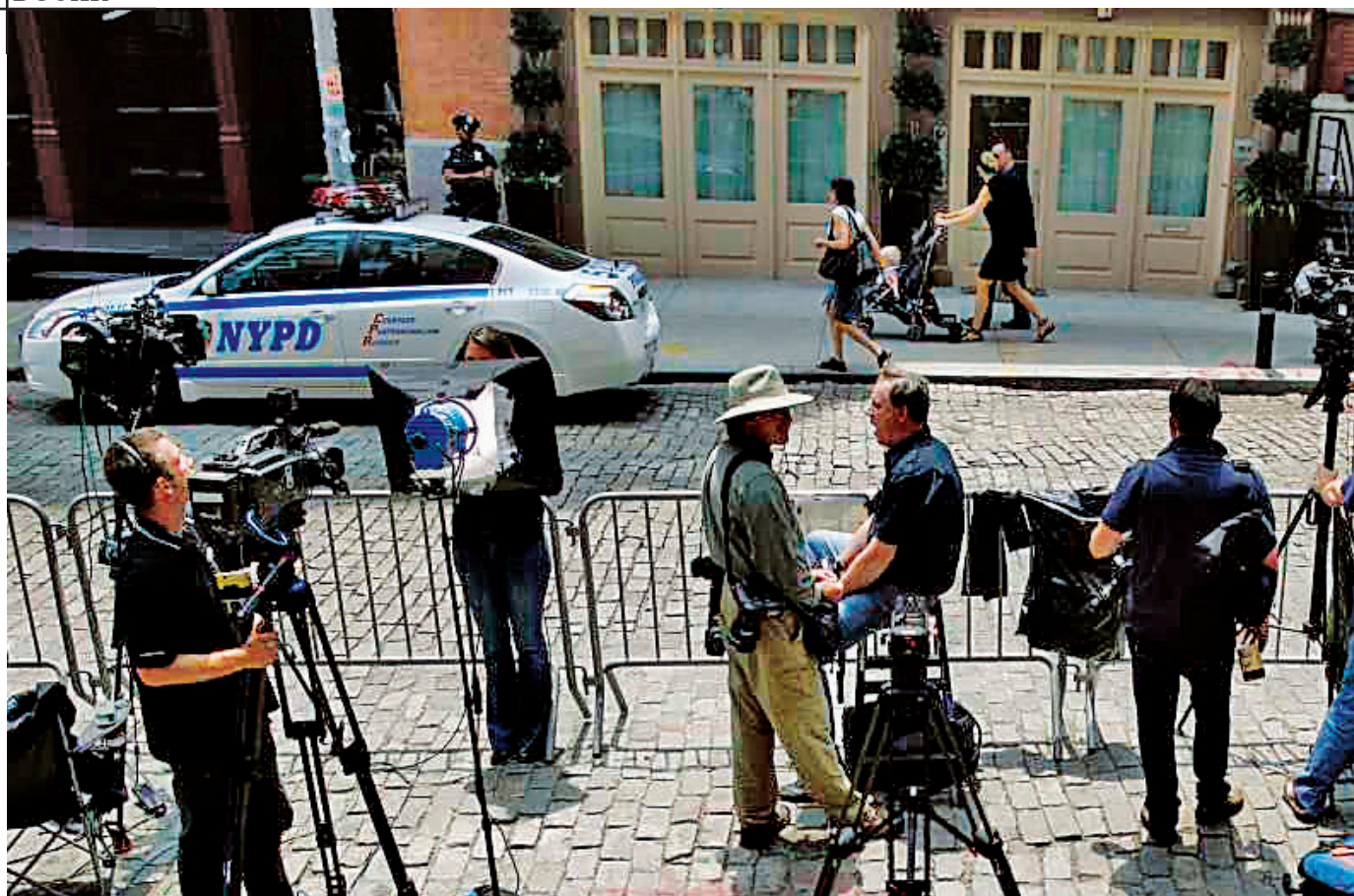
Presa, la pândă, în fața imobilului închiriat de DSK