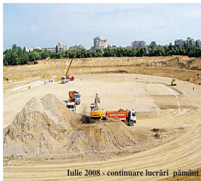
Iulie 2008 - continuare lucrări pământ