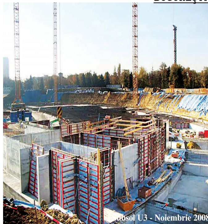
absol U3 - Noiembrie 2008

meciului contra Argentinei, Oprescu s-a gândit să organizeze o noapte albă a muzicii, la care să invite atât trupe din străinătate, cât și autohtone. Primarul și-ar dori de altfel ca viitorul management al arenei să asigure organizarea unor evenimente culturale în afara celor sportive, tot timpul anului. De menționat că stadionul va avea o parcare de 1.400 de locuri al cărei cost este estimat la patru milioane de euro. Ea va fi realizată pe două etaje, urmând ca pe terasa acesteia să fie amenajat un teren polivalent. Riveranii își vor putea parca gratuit mașinile când nu sunt organizate manifestări sportive sau artistice. Pe noul stadion vor fi mai multe puncte, peste 50, din care spectatorii să-și poată achiziționa mâncare sau băutură. Magazinele, restaurantele, automatele de vânzare vor fi prevăzute toate cu cititoare speciale care vor deduce o sumă de bani de pe un card preplătit. Acest card va fi achiziționat de la punctele de vânzare din stadion.