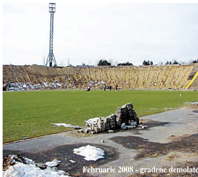
Februarie 2008 - gradene demolate