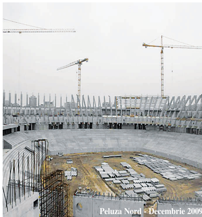
Peluza Nord - Decembrie 2009