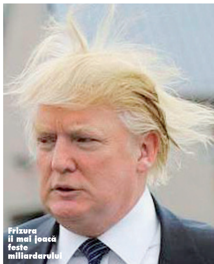
Frizura ii mai joacă feste miliardarului