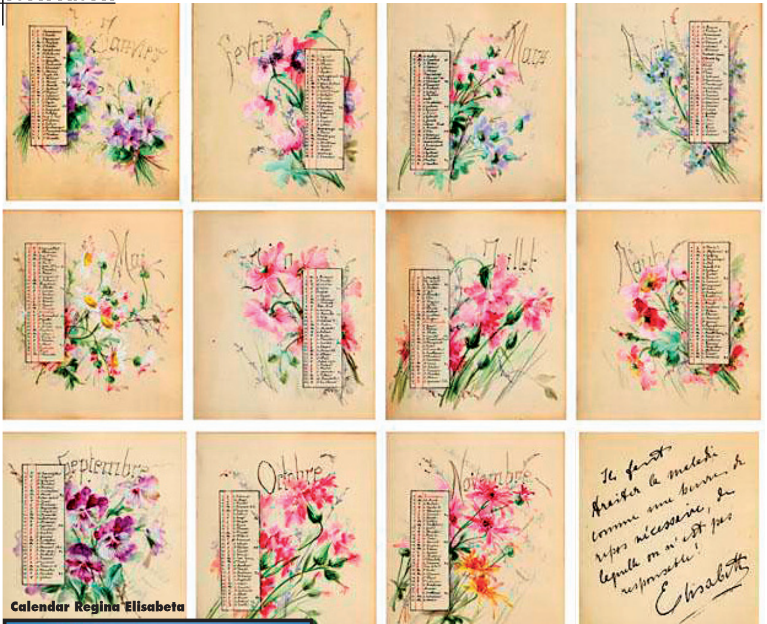
Calendar Regina Elisabeta