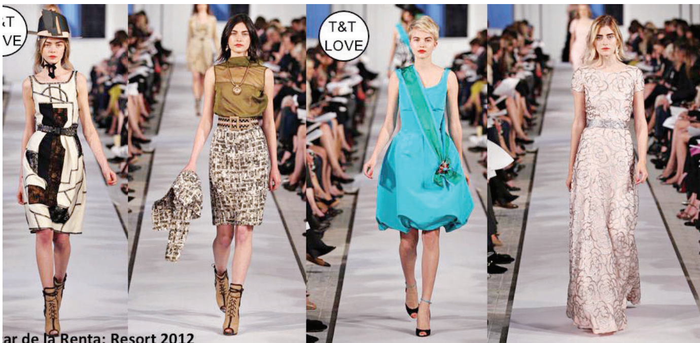
ar de la Renta: Resort 2012

Brandul Oscar de la Renta s-a dovedit a fi un mare succes, atât datorită talentului incontestabil al designerului, cât și pasiunii sale latine, ambele combinate cu experiența europeană. Republica Dominicană este minunat reflectată în creațiile sale, prin model și culoare, dar influențele spaniole sunt tot atât de puternice, fiindcă muzica și corida l-au impresionat profund pe designer, în tinerețe. Poate de aceea fiecare nouă colecție semnată de celebrul designer a fost urmată de cronici elogioase care l-au transformat pe creator într-un favorit al clienților celebri, vedetele de la Hollywood preferând de multe ori să apară pe covorul roșu, purtând rochiile semnate de la Renta. Firește, această glorie i-a adus doar bucurii și satisfacție, declarând că "Moda este o modă numai atunci când femeia o poartă". Și atunci când a fost întrebat de ce îl adoră soțiile președinților din mai toată lumea, cu umorul său bine știut a răspuns: "Sper că doamnele nu mă preferă din pricina vârstei". Pasiunea lui Oscar pentru modelling i-a adus nu doar celebritatea internațională, ci și poziții de top în lumea profesioniștilor din această domeniu. Timp de șapte ani a ocupat funcția de președinte al Consiliului American de Modă și Design, obținând în același timp prestigioase distincții, printre care "Designerul anului", în 2000 și 2007, diplomă oferită de Consiliul American de Modă și