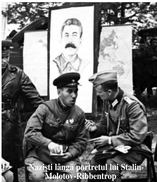
Naziști lângă portretul lui Stalin-Molotov-Ribbentrop