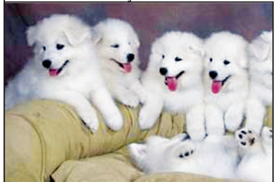
Căinele zăpezii zâmbește continuu