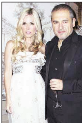
Elie Saab și rochiile sale de poveste