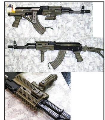
Legenda ”Avtomat Kalașnikov”