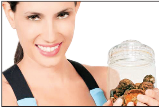
“Ciuperca lui Dumnezeu”, leac anticancer