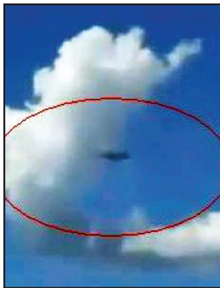
Ne pregătim de invazia extraterestrilor?