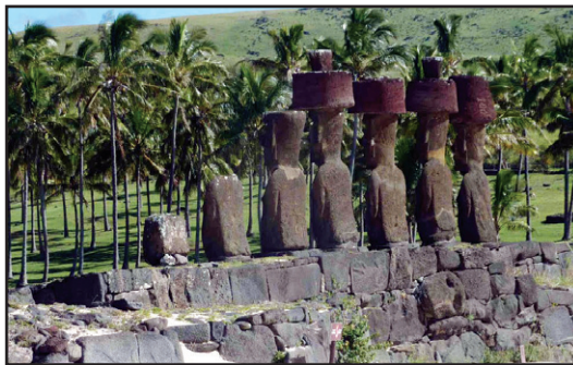
Misterioasele statui din Insula Paștelui au și corp!