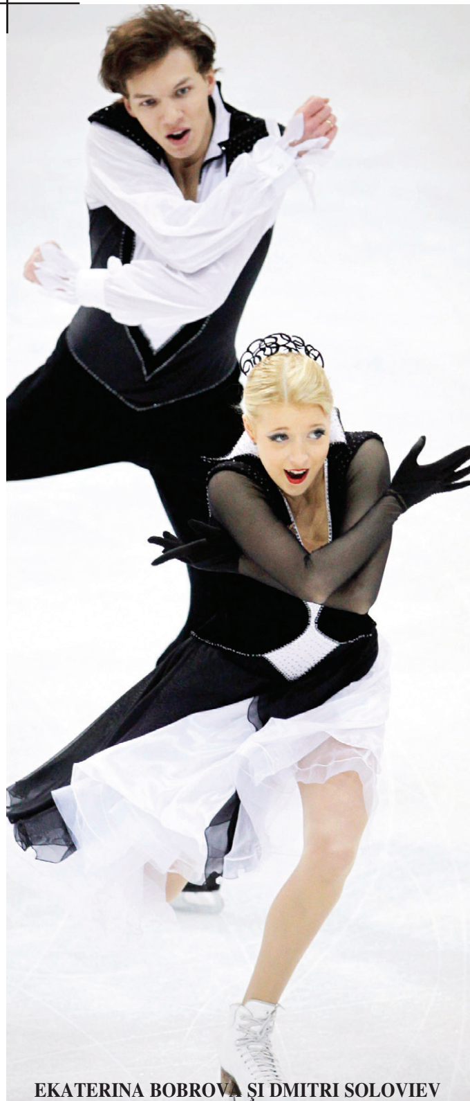
EKATERINA BOBROVA ȘI DMITRI SOLOVIEV