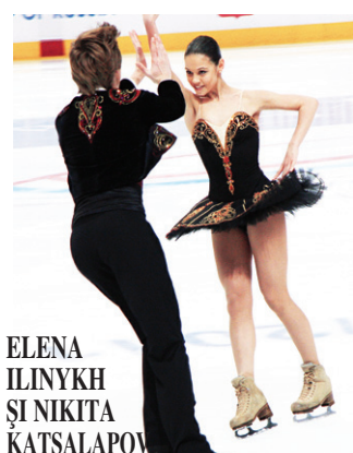
ELENA ILINYKH ȘI NIKITA KATSALAPOV