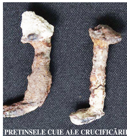
PRETINSELE CUIE ALE CRUCIFICĂRII