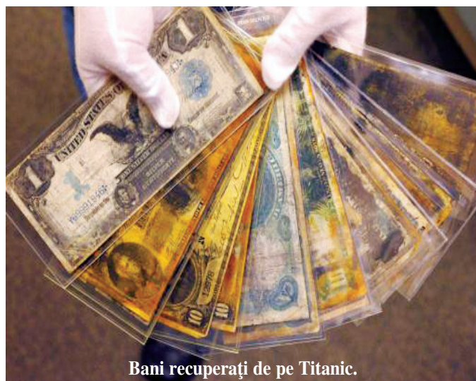
Bani recuperați de pe Titanic.