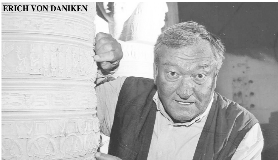
ERICH VON DANIKEN