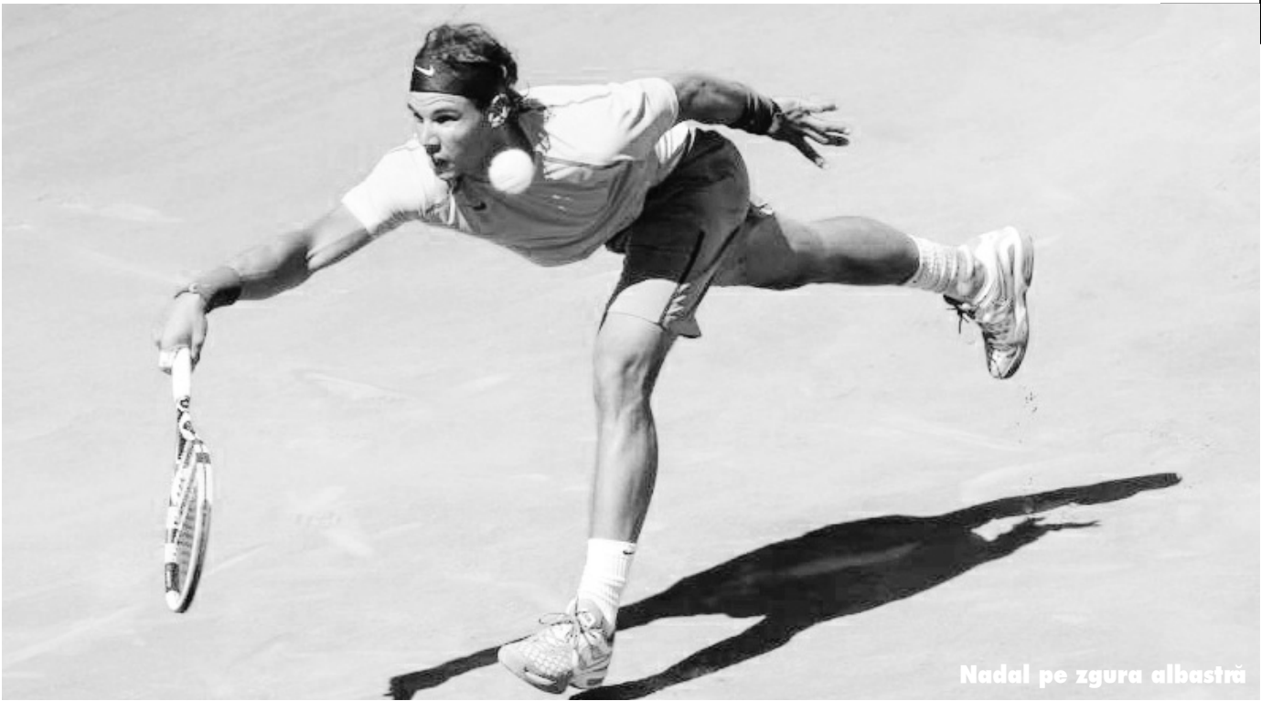
Nadal pe zgura albastră

rămâne. Sunt doi sau trei jucători (nemulțumiți -n.n.), care sunt foarte importanți, este adevărat. Dar un promotor știe că un mare eveniment nu se poate clădi pe un singur tenismen. Dimpotrivă. Acest turneu este foarte mare, în zece ani a progresat cel mai mult. Spania merită acest turneu! Spania va mai avea cinci de Nadal în viitor, deși nu va fi ușor, pentru că astfel de jucători nu se cumpără. Un Nadal se naște “. Românil a adăugat însă că Spania are un potențial imens în ceea ce privește tenisul și nu depinde numai de Nadal. Ca dovadă că a câștigat Cupa Davis fără acest jucător. Ion Țiriac a menționat că a intuit că vor exista critici încă din prima zi, când a văzut că zgura este alunecoasă. “Ceea ce mă deranjează este că niciun ziarist nu a spus că albastrul este mai bun decât culoarea roșie. Mingea se vede mai bine și spectatorul este încântat, ceea ce mă interesa foarte mult. Îmi asum criticile. Dar eu nu fac pista. Eu sunt nimeni aici, nu am nicio funcție. Administratorii din tenis au evaluat situația. Au trimis oameni să testeze zgura, au luat probe chimice pentru a confirma că nu există ceva nociv. Au fost cinci ani de teste”, a explicat el. Țiriac a declarat că nu a vorbit aproape cu niciun jucător despre