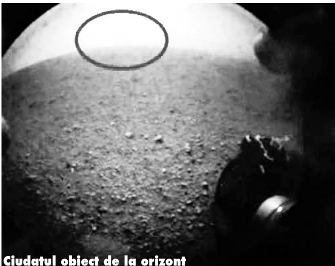
Ciudatul obiect de la orizont