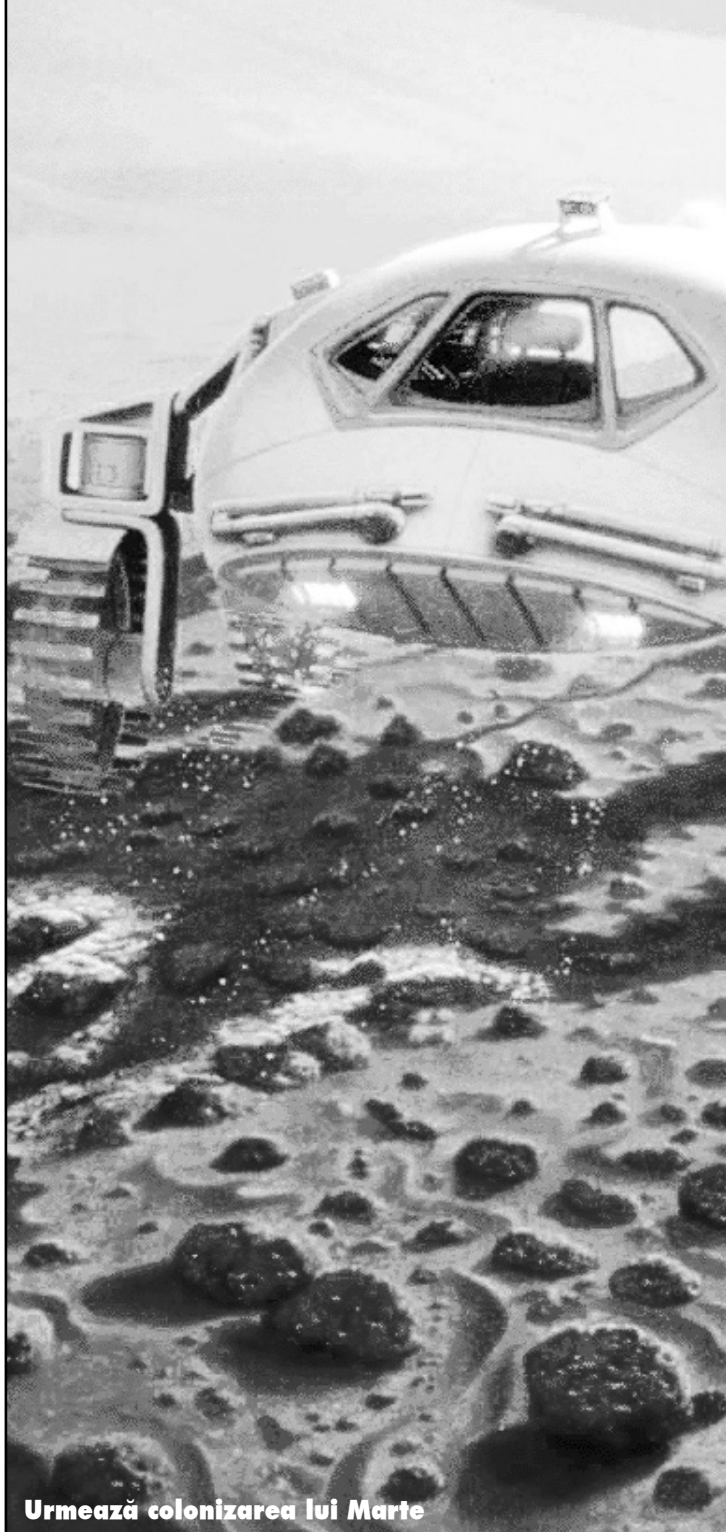
Urmează colonizarea lui Marte

Robotul NASA, care a ajuns la 5 august pe Marte - la capătul unei călătorii de mai bine de 8 luni, în care a parcurs 570 de milioane de kilometri - a înregistrat temperaturi mai mari de zero grade Celsius, ceea ce e un semn încurajator legat de posi-