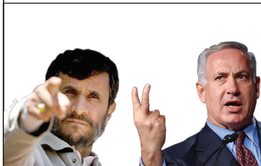
Războiul cu Iranul...nu dacă, ci când?