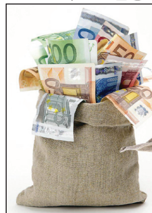
CE taie dur din banii alocați României