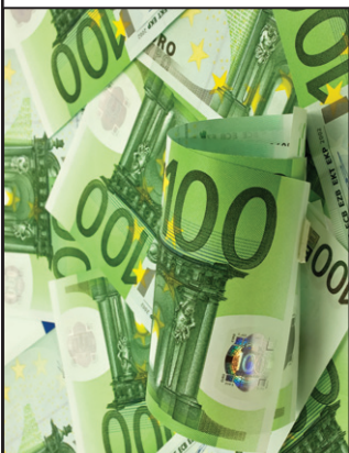
Uniunea bancară, antidotul crizei