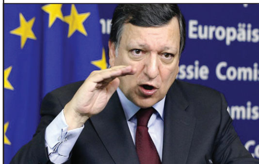
Meciul politic dâmbovițean arbitrat de la Bruxelles