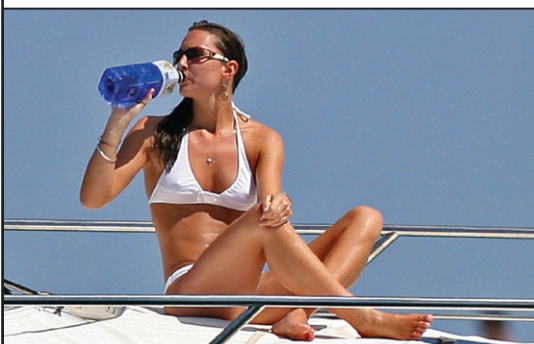
Bătălia cu paparazzi câștigată de Ducesa Kate