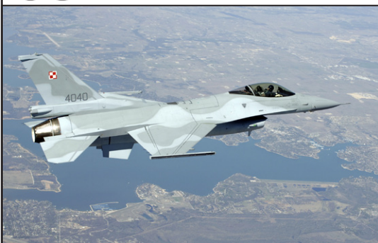
De la Mig 21, la F 16