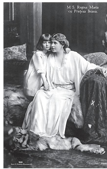
M. S. Regina Maria cu Prințesa Ileana.