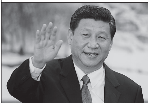
Misteriosul domn Xi Jinping