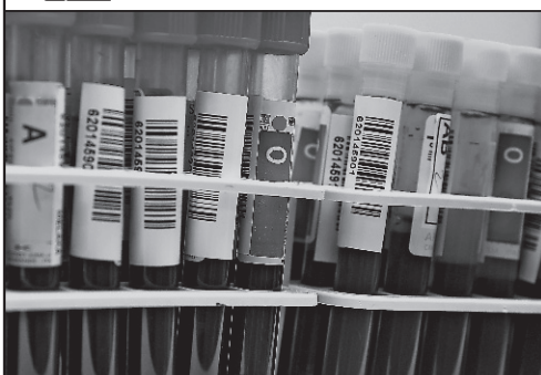
Grupele sanguine, personalitatea și bolile