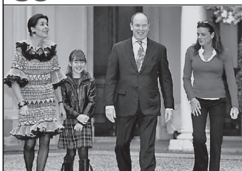
Caroline de Monaco, o bunică princiară