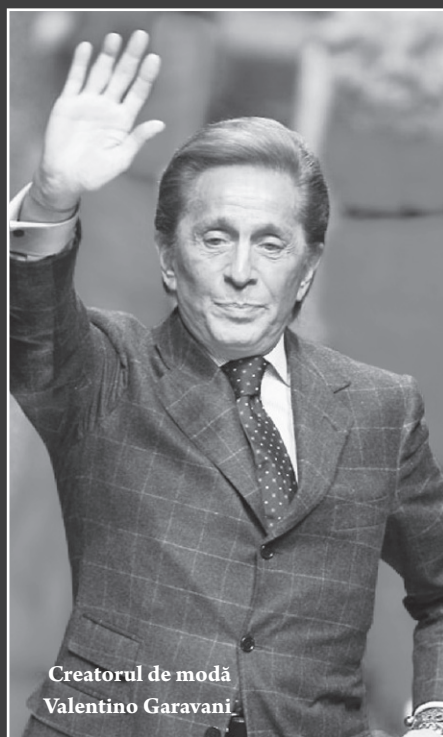
Creatorul de modă Valentino Garavani