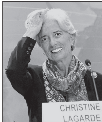
FMI își face MEA CULPA