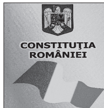
Ușor cu noua Constituție pe scări!