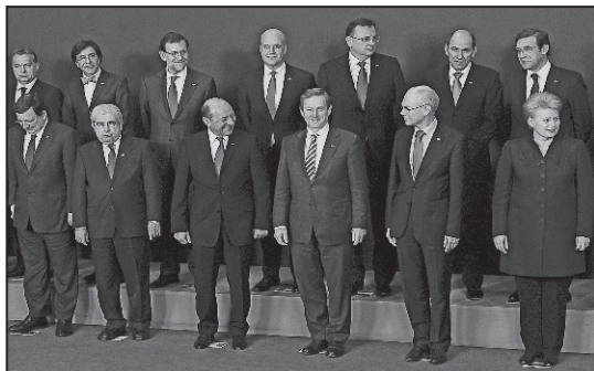
Bugetul UE, mărul discordiei