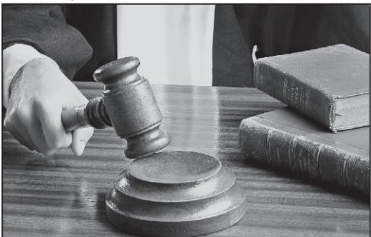
Marile dosare, sezonul de primăvară