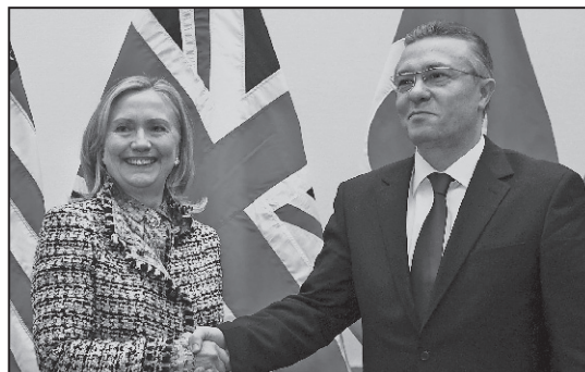
Hillary Clinton – pe culmile popularității