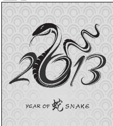
Ce ne aduce Anul Șarpelui de apă?