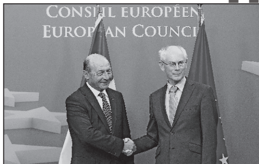
Raportul MCV ne ține la ușa Schengen