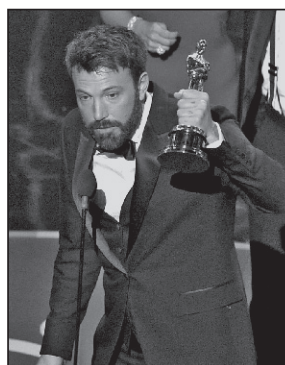
"Argo", marele câștigător al galei Oscar-urilor