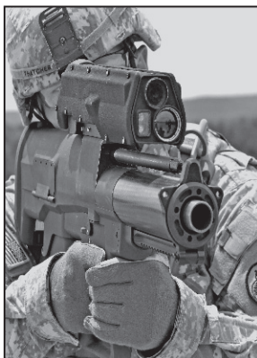
Armele viitorului imposibil de detectat și de oprit