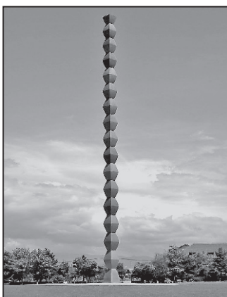
Coloana Infinitului emite pe o rază de 300 m