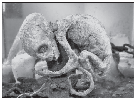
Extraterestrii minusculi ajută pământeni