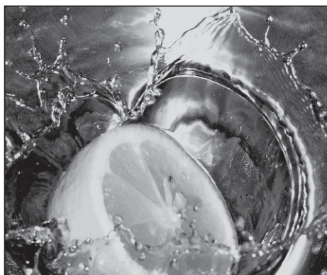
Ce miracole face lămâia