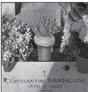
Brâncuși își va redobândi cetățenia română