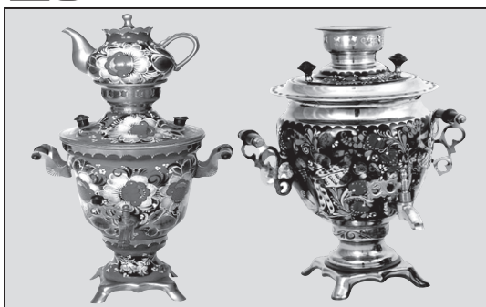
Samovarul, semnul ospitalității