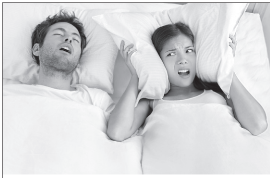
Boala somnului, între sforăit și moartea subită