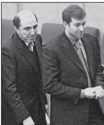
Blestemul averilor lovește oligarhii ruși