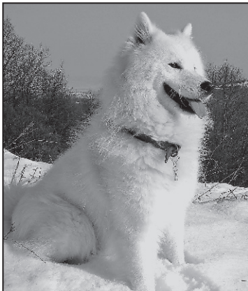
Scumpi... la propriu și la figurat