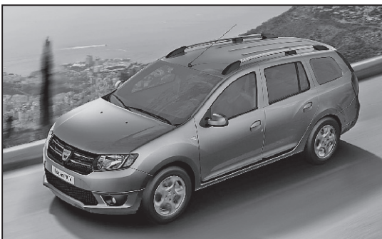
Noul Logan break și-un Duster aventuros