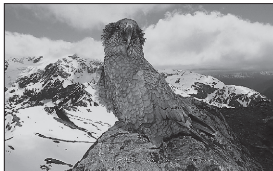
Kea, cel mai ciudat și mai deștept papagal