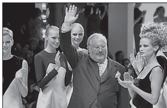
Gianfranco Ferré, arhitectul modei