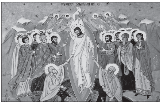
Sfintele Paști, minunea Învierii lui Iisus