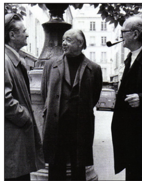
Mircea Eliade a refuzat invitațiile lui Ceaușescu de a veni în țară