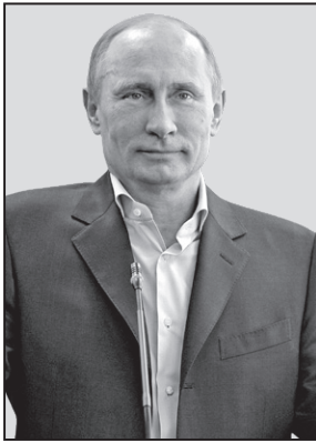
Volodea Putin, spionul care le-a tras-o