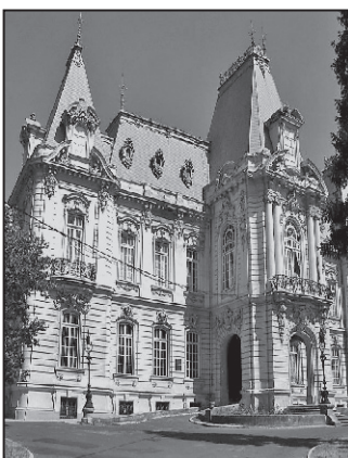
Dinu Mihail a cerut voie regelui să-și acopere palatul cu monezi de aur