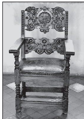
Scaunele, repere de istorie