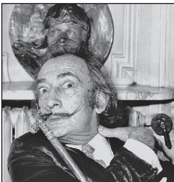
Dali își doarme sommul de veci într-un muzeu