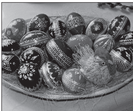
Liber la ouă roșii! Sunt sănătoase!