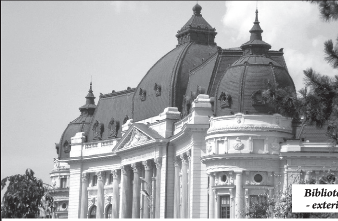
Biblioteca București - exterior și interior