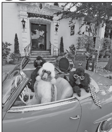
Orașul cel mai prietenos cu câinii