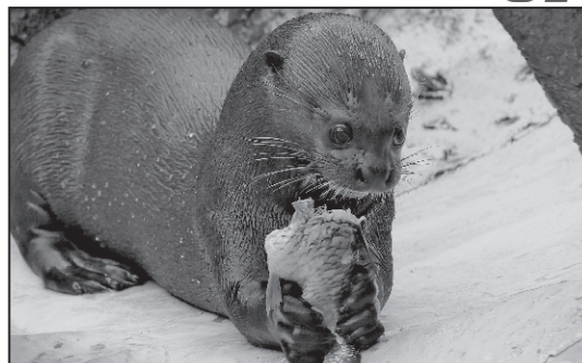
Sancho și Carolina – o poveste emoționantă