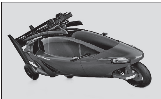
Păzea, sosesc zburătoarele!