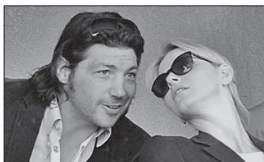
Prințesa Charlene, cucerită de un rugbist?