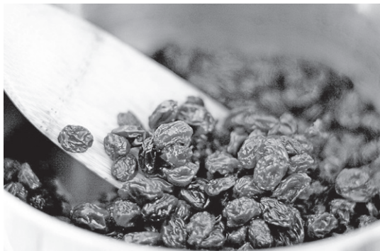
Stafidele mențin corpul sănătos și viguros