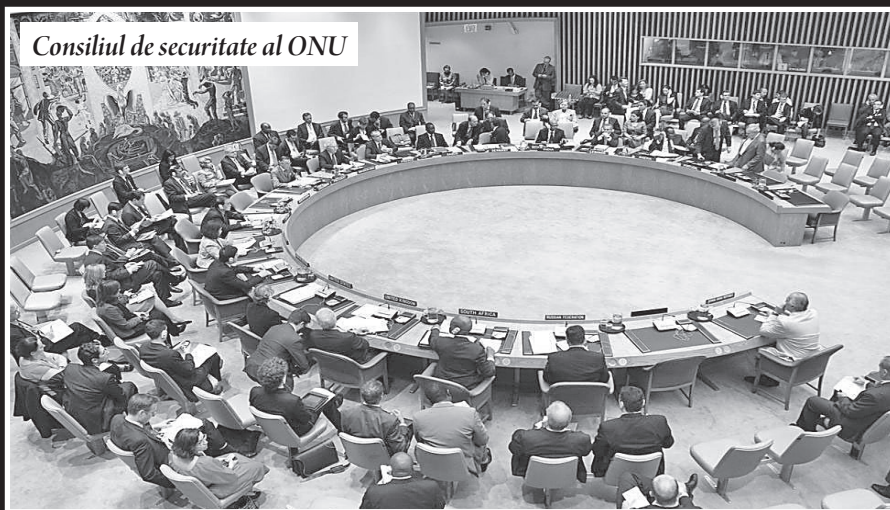
Consiliul de securitate al ONU